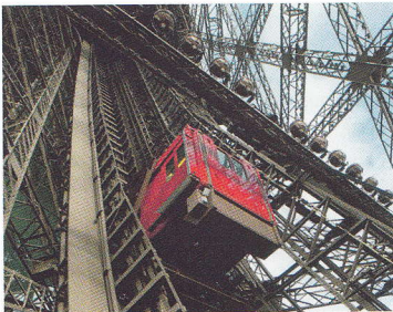
Gondola de la Turnul Eiffel

Și alți președinți au vrut să lase o moștenire orașului: Jacques Chirac a lăsat Muzeul Quai Branly (pagina 37), iar Nicolas Sarkozy a vrut să își asigure moștenirea atât prin arhitectură, cât și prin infrastructură. Proiectul său „Grand Paris” (Marele Paris) a pus la bătaie pentru început 35 de miliarde de euro pentru un nou sistem de transport suburban: 10 arhitecți de primă clasă au fost invitați să își prezinte viziunea pentru un Paris mai mare și mai omogen. În prezent, sunt în construcție mai mulți zgârie-nori (clădiri ce au fost mult timp interzise în Paris), printre care și complexul Hermitage, proiectat de Sir Norman Foster; unul dintre cele două turnuri ale complexului va avea o înălțime de 323 m și va fi cea mai înaltă clădire din UE. Lucrările vor fi finalizate în 2021. O altă clădire de proporții, hotelul Triangle Tower este programat să fie finalizat în 2018. În ultimii ani, s-au deschis și muzee noi, iar o parte dintre muzeele cunoscute s-au extins: noua aripă dedicată Artei Islamice a muzeului Luvru, proiectată de Rudy Ricciotti și Mario Bellini, s-a deschis în 2012; Fundația Louis Vuitton, proiectată de Frank Gehry, a fost dată în folosință în 2014, iar noua clădire a Filarmonicii din Paris și-a deschis porțile iubitorilor de muzică în 2015.