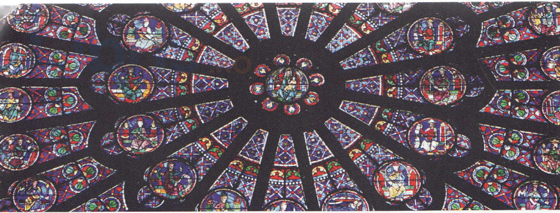
Minunatele vitralii de la Notre-Dame

lei. Nu este de mirare că scriitorul Jean Giraudoux (1882–1944) a spus că parizienii sunt mândri să facă parte dintr-un oraș unde „se gândește, se discută și se scrie mai mult decât oriunde altundeva în lume”.