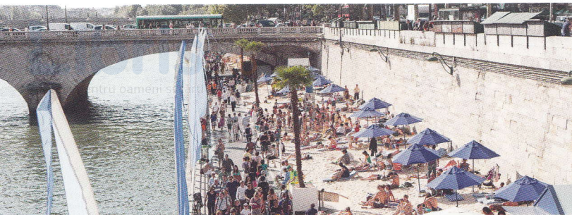
Paris-Plage aduce plaja în oraș