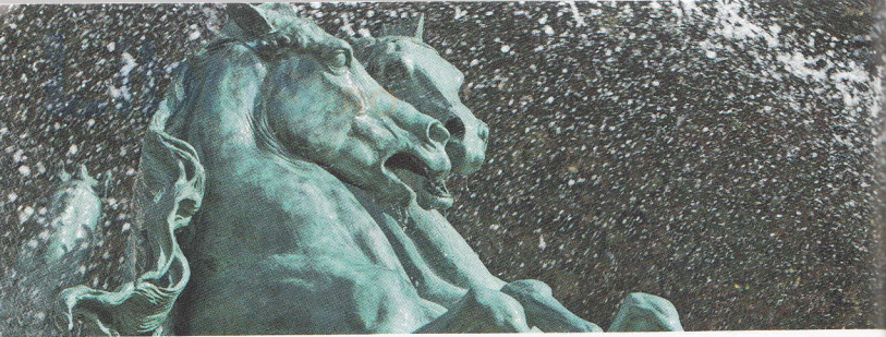
O sculptură din Grădinile Luxembourg

În același timp, a apărut și o formă mai grandioasă, neoclasică a modernismului, cel mai bine reprezentată de arhitectura Palatului Chailot (pagina 71).